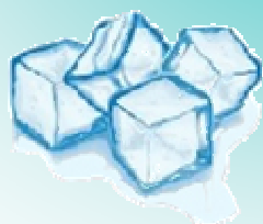
Sensation de froid