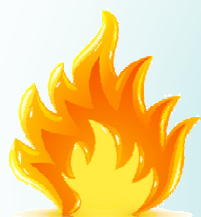
Sensation de brûlures